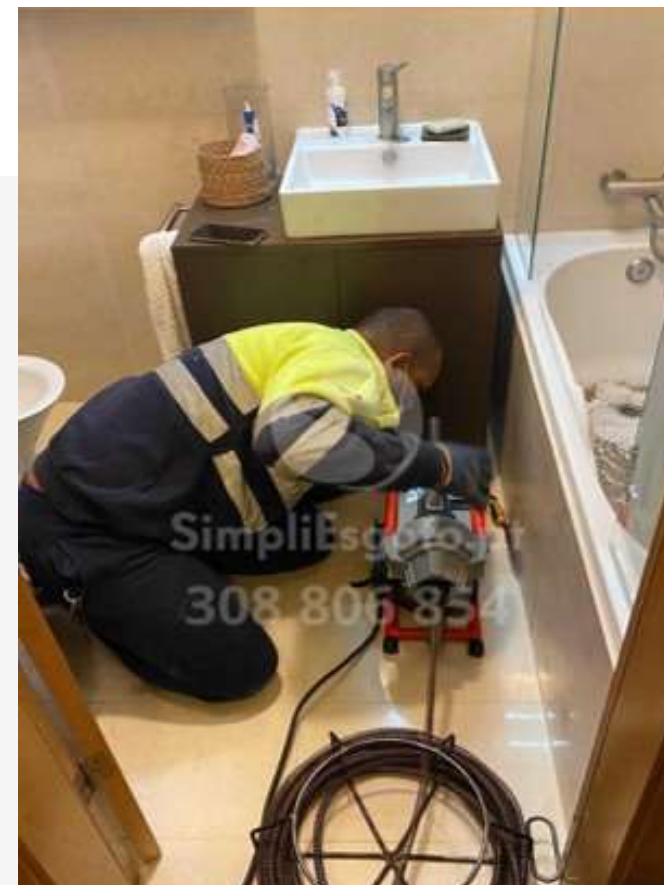
Sistema de Molas