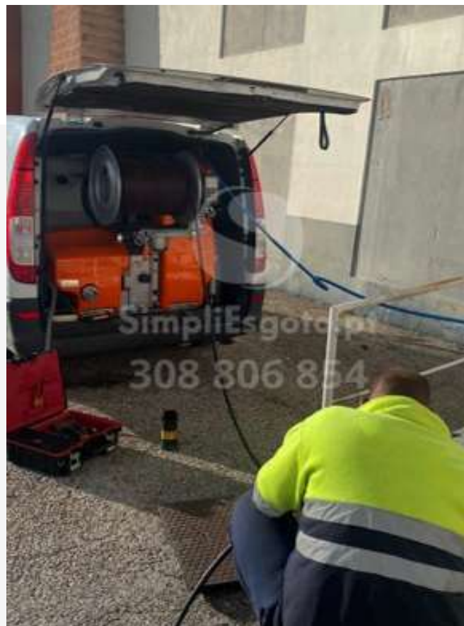
Sistema de Hidrojacto

As nossas intervenções são caracterizadas por um diagnóstico detalhado que nos permite avaliar cada situação em particular e definir qual o método mais adequado para a resolução do problema.